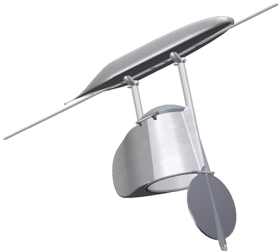
Рис. 4. Моно-юникар с открытым люком