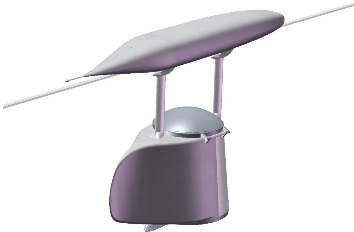
Рис. 1. Общий вид высокоаэродинамичного моно-юникара (вид с кормы)