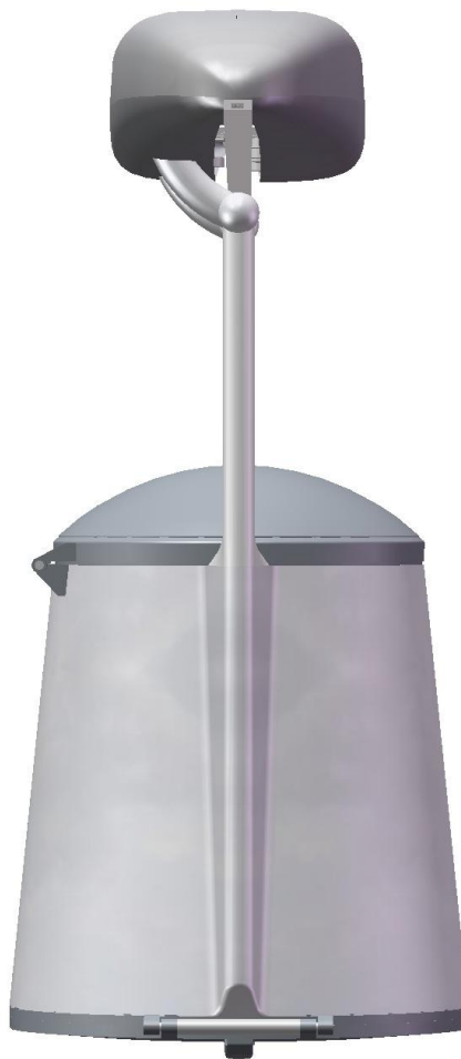
Рис. 2. Вид на моно-юникар спереди