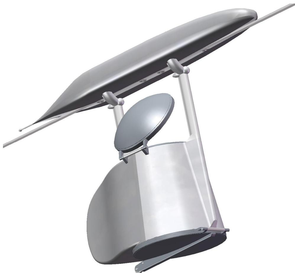
Рис. 3. Моно-юникар с поднятой крышкой